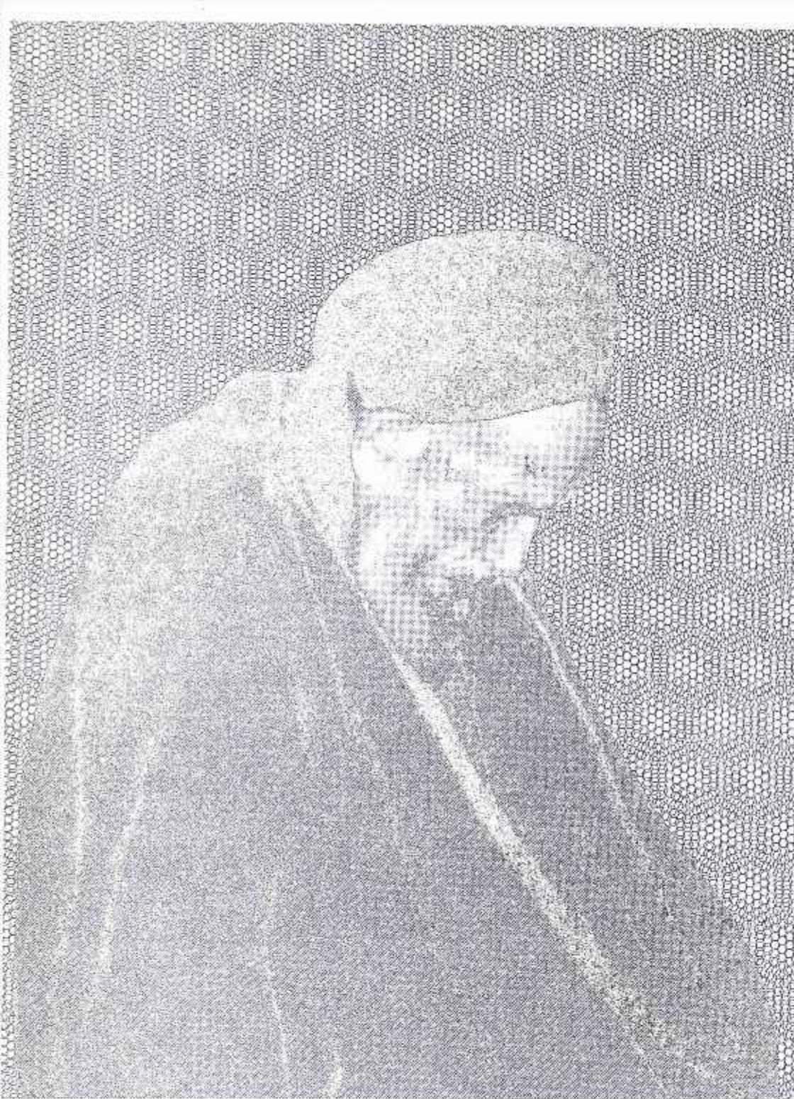
علامہ محقق سید مرتضیٰ عسکری